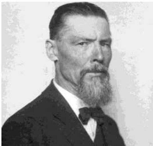
prof. Jože Plečnik